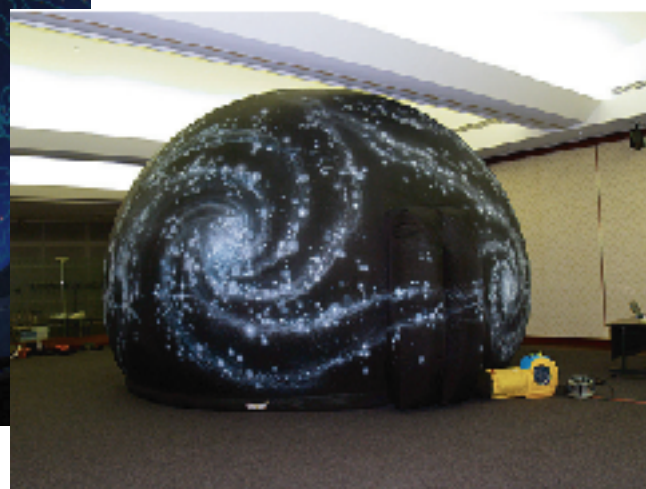
移動式プラネタリウム、直径6m